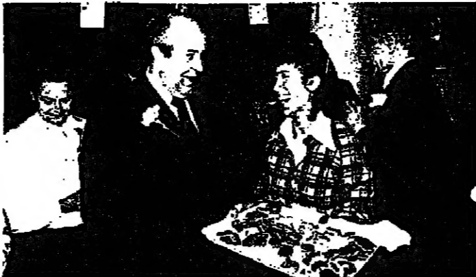
بني فور رئيس الجامعة

من حياة لبنان ومماته ، وما مر عليه من ويلات وحروب .